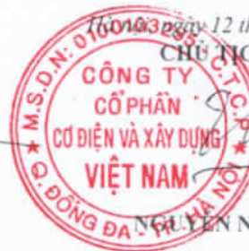
NINH THỊ LUÂN

16/03/2015 ngày 12 tháng 11 năm 2015 CHỦ TỊCH HĐQT